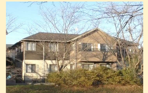
らいおんホームそが

今大会も多くの関心をいただき、参加申し込み者は660名、動画視聴数3,045回となりました。今大会を視聴いただいた皆様とともに、テーマにある「未来に繋ぐグループホーム～今、求められているもの」が形となり、様々な生き方を認め合える居場所が増えることへの足掛かりとなることを願っています。